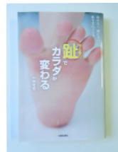
趾でカラダが変わる