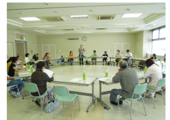
8月4日開催「登録難病ボランティアと難病患者団体との懇談会」の様子

難病患者就職セミナー・就労相談会 H26年2月19日午後1時～5時 中北保健福祉事務所2階会議室