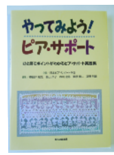
やってみよう! ピア・サポート