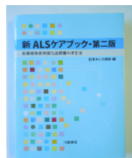
新ALSケアブック 第2版