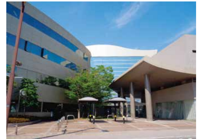
山梨県福祉プラザ 国立甲府病院 西側

また、4月から新しい相談支援員2名を迎え、相談支援員3名で事業に取り組んでいます。今年度は、新型コロナ感染の影響があり、収束の経緯を見極め、感染予防策を整えて、慎重に事業を進めていく予定です。交流会、医療相談会などの開催事業については、随時ホームページや新聞、個別通知等でご案内をさせていただきます。ご不明な点は、どうぞお気軽にお問い合わせください。